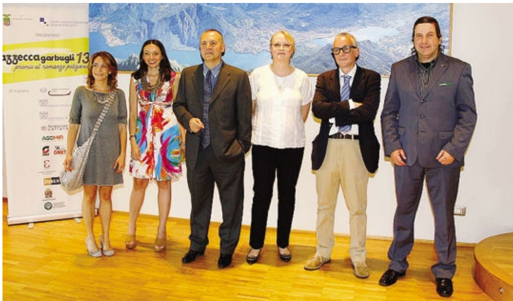
La giuria che ha selezionato le cinque opere finaliste al Premio Azzecagarbugli